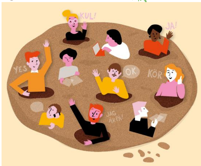
Illustration: SKR Att driva omställning nära vard.pdf (skr.se)